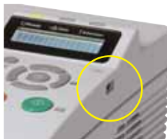
FS-1370DN: Imprima suas arquivos diretamente a partir da memória utilizando a conveniente Interface USB Host