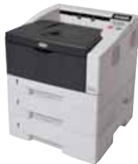
FS-1320D (acima) e FS-1370DN mostrados com dois alimentadores de papel adicionais.