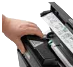
Substitua o frasco de toner de longa duração com facilidade e rapidez