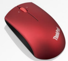
Mouse Wireless Vermelho PN 0B47165