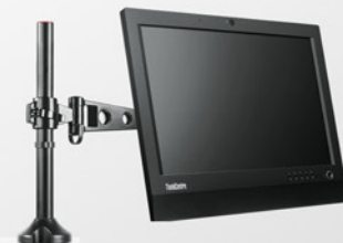
Braço extensor para All-in-One e Monitor PN 57Y4352

A Lenovo conta com um variado portfólio de acessórios, incluindo baterias, memórias, hds, dockstations, ac adapters entre outros. Para conhecer melhor nossos acessórios e compatibilidade acesse: