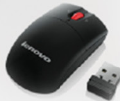
Mini Mouse sem fio com microrreceptor (inclui pilhas) PN 0A36188