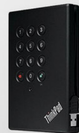
HD Externo USB Criptografado 750GB PN 0A65616