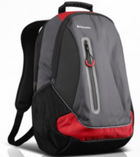
Mochila Sport Lenovo Vermelha PN 0A33896