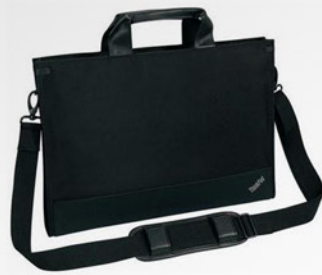
Maleta para Ultrabook PN 0B95750