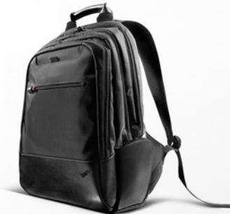
Mochila Executiva ThinkPad PN 43R24B2