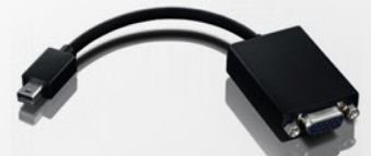
Cabo Adaptador Mini Display Port para VGA PN 0A36536