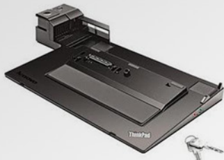
ThinkPad Mini Dock Séries 3 with USB 3.0 PN 433715P