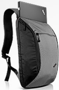
Mochila Ultralight PN 0B47306