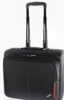
Mochila Roller ThinkPad PN 7BY2375