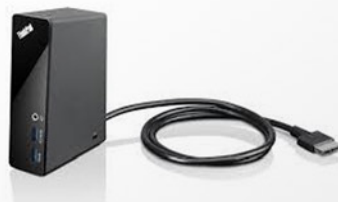
One Link Dock PN 4X10A06080