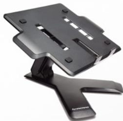
Suporte para Notebook Lenovo Essential PN 45J9292