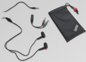
Fone de ouvido ThinkPad In-Ear com microfone PN 57Y4488