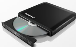
Gravador de DVD USB Lenovo PN 0A33988