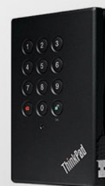
HD Externo USB Criptografado 750GB PN 0A65616