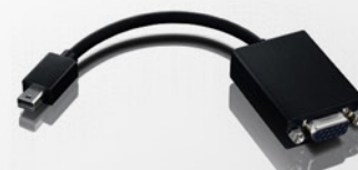
Cabo Adaptador Mini Display Port para VGA PN 0A36536