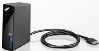
One Link Dock PN 4X10A06080