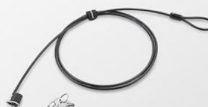
Cabo de Segurança PN 57Y4303