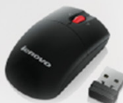
Mini Mouse sem fio com microrreceptor (inclui pilhas) PN 0A36188