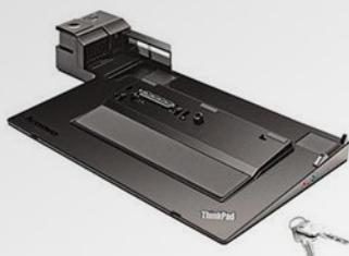
ThinkPad Mini Dock Séries 3 with USB 3.0 PN 433715P