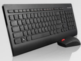
Teclado e Mouse sem fio Lenovo Ultralim PN 0A34070