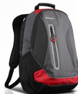
Mochila Sport Lenovo Vermelha PN 0A33896