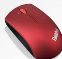
Mouse Wireless Vermelho PN 0B47165