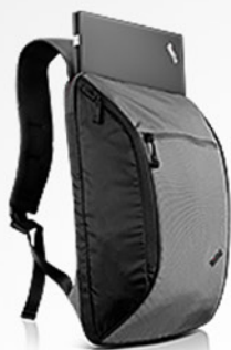
Mochila Ultralight PN 0B47306