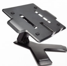
Suporte para Notebook Lenovo Essential PN 45J9292