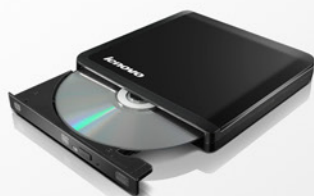
Gravador de DVD USB Lenovo PN 0A33988