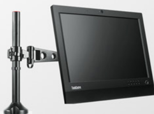
Braço extensor para All-in-One e Monitor PN 57Y4352

A Lenovo conta com um variado portfólio de acessórios, incluindo baterias, memórias, hds, dockstations, ac adapters entre outros. Para conhecer melhor nossos acessórios e compatibilidade acesse: