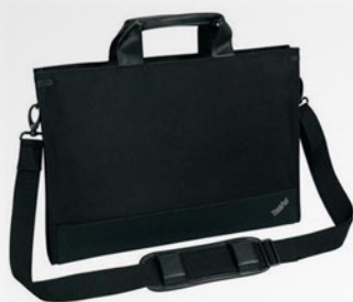
Maleta para Ultrabook PN 0B95750