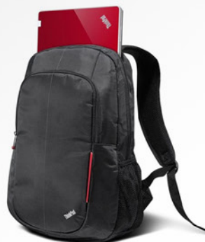
Mochila Essencial PN 78Y2371