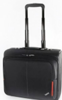
Mochila Roller ThinkPad PN 7BY2375