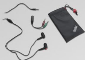
Fone de ouvido ThinkPad In-Ear com microfone PN 57Y4488