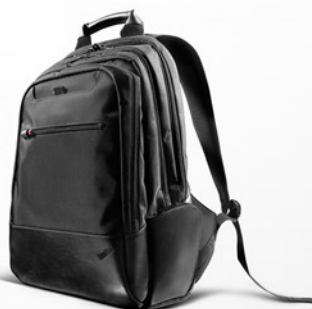
Mochila Executiva ThinkPad PN 43R24B2