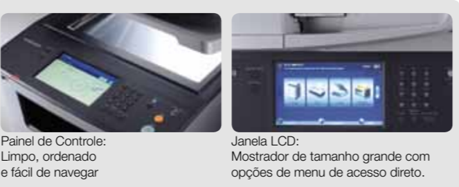
Painel de Controle: Limpo, ordenado e fácil de navegar

Simplifique as tarefas com uma tela LCD colorida de toque de 7 polegadas que elimina botões físicos. As informações são exibidas clara e concisamente, com a maioria das opções de menu acessíveis diretamente na LCD. A navegação intuitiva minimiza o tempo de operação. Cada segundo economizado conta para o aumento da produtividade.