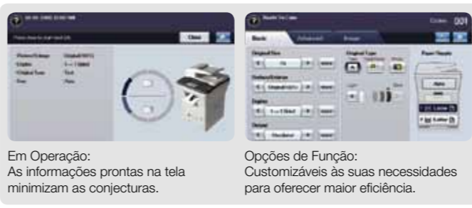
Em Operação: As informações prontas na tela minimizam as conjecturas.

Viaje por muitas funções com uma interface simples de usar. A ajuda em geral pode ser obtida através da conveniente funcionalidade “User Tips (Dicas do Usuário)”. Você também pode puxar instantaneamente uma exibição de todo o fluxo e organização de menu.