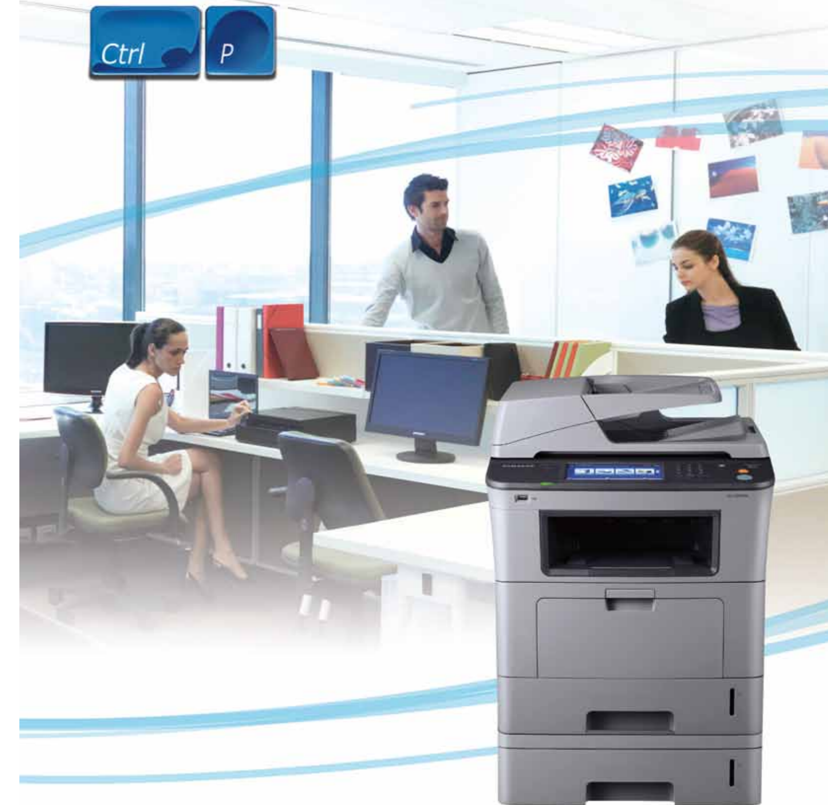
Multifuncional Laser Monocromática Samsung SCX-5835FN/NX

Um equipamento indispensável em seu escritório